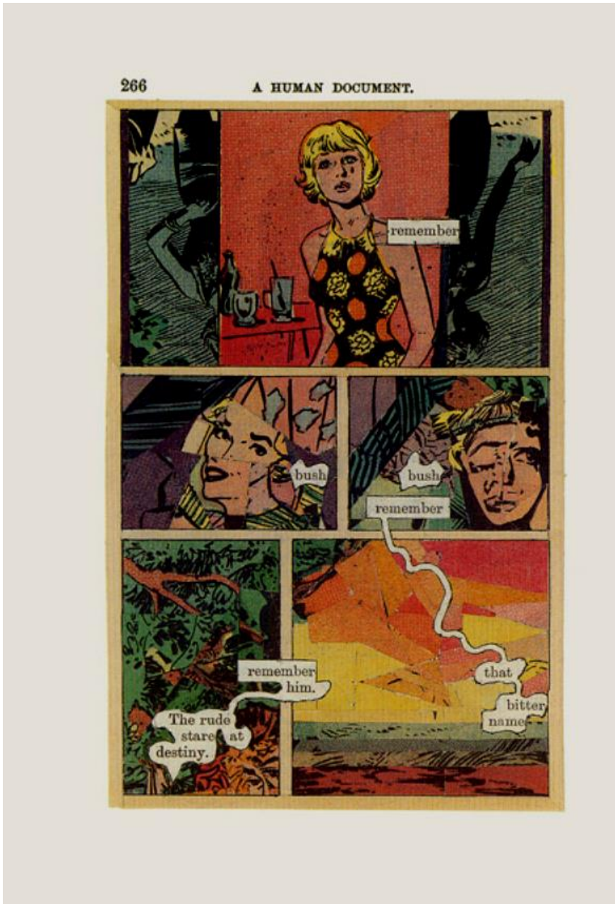
Fig. 2 - Tom Phillips, A Humument , 2016, p. 266 © SABAM Belgium 2021