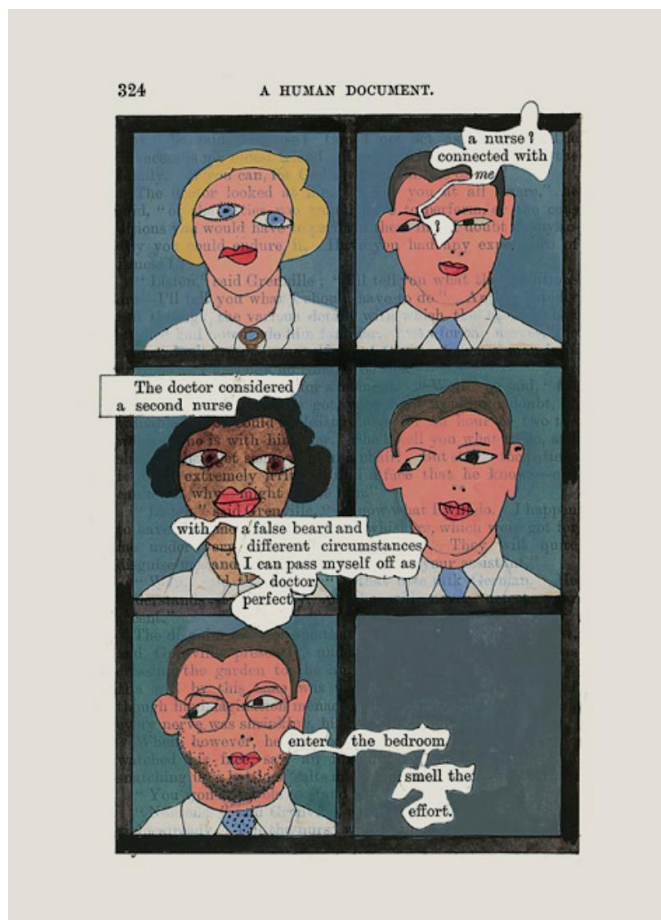
Fig. 3 – Tom Phillips, A Humument , 2016, p. 324

La Police, se sont d'ailleurs fait une spécialité, le plus souvent à des fins burlesques. 11 Sur cette page spécifique, Phillips semble en effet prendre plaisir à simuler une incompétence sur le plan graphique, feintise dont, à l'évidence, il joue sciemment. 12