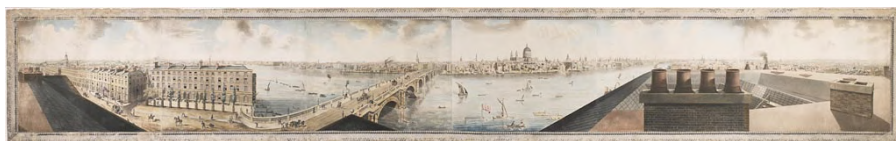
Fig. 1 – Robert Barker, Henry Aston Barker, Panorama: London from the Roof of Albion Mills , acquatinta a colori su tela di lino, Government Hospitality, Lancaster House, Londra, 1792

Proprio di panorami (fig. 1) si occupa il presente intervento e in particolare del racconto di un panorama d'invenzione, quello narrato dallo scrittore giapponese Edogawa Ranpo (1894-1965), pseudonimo di Tarō Hirai, che tra il 1926 e il 1927 pubblicò La strana storia dell'Isola Panorama ( Panoramatō kidan 1 ). Maestro della letteratura noir e poliziesca declinata secondo il gusto ero guro nansensu (abbreviazioni derivate dai termini inglesi erotic , grotesque e nonsense ), Ranpo fu un grande appassionato dell'immagine in movimento, come dimostra una serie di manoscritti ritrovati e analizzati da Naoki Fujimoto (2019). Ciò che colpisce nella sua produzione di fiction, tuttavia, è il costante riferirsi a dispositivi ottici e illusionistici per farne elementi cruciali della narrazione, come accade nel racconto L'inferno degli specchi (1926) 2 , o ne L'uomo in viaggio con il ritratto di broccato (1929) in cui un uomo riesce a spostarsi nello spazio e nel tempo grazie a un binocolo 3 .