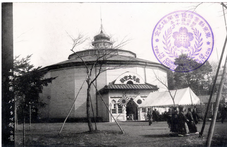
Fig. 4 – Ueno Panoramakan (Panorama di Ueno) , Parco di Ueno, Tokyo, 1910 ca.

Il ricorrere del termine "arte" nel romanzo è piuttosto sintomatico. Sebbene sia Hitomi stesso a considerare i panorami storici null'altro che attrazioni spettacolari, il suo intento è quello di creare con essi una grandiosa opera artistica 13 , in aperto contrasto con la comune percezione estetica che al tempo si aveva di essi in Occidente e in Giappone.