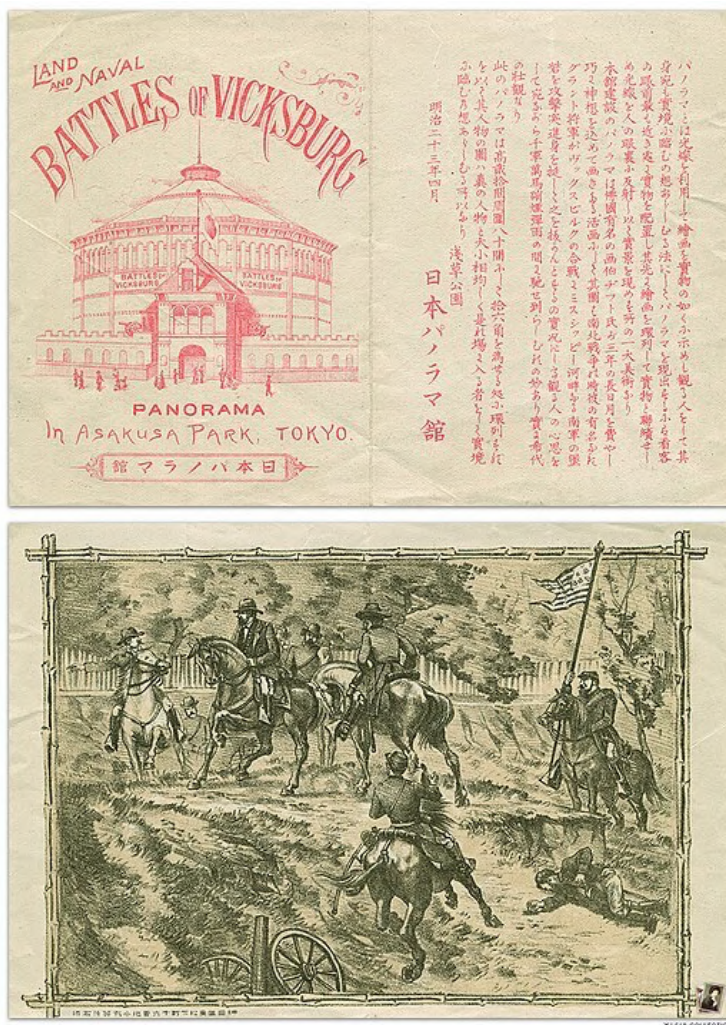
Fig. 3 – Land and Naval Battles of Vicksburg, Panorama in Asakusa Park, Tokyo , stampa pubblicitaria per un ciclorama di Lucien-Pierre Sergent, 1890 ca.

mono. Lo dimostra una lunga descrizione di un dispositivo panoramico, apparsa nell'agosto del 1926 (appena prima della pubblicazione de La strana storia ) sulla rivista "Tantei shum", che probabilmente fa riferimento a un panorama visto da bambino nella sua città natale, Nagoya 8 .