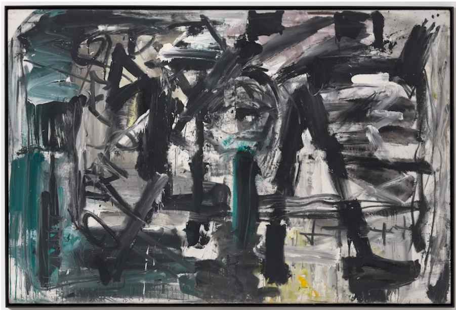
Fig. 6 – Emilio Vedova, Emerging '82 , 1982.

Accanto ai maestri, la selezione include figure di rilievo del dopoguerra, come Giulio Turcato (1912-1995), con diverse opere, fra cui Ascesa in giallo (1982), che evidenzia il dialogo tra colore, gesto e materialità. Emilio Vedova (1919-2006), con Omaggio a Dada Berlin (1965) e tre opere del ciclo Emerging '82 (1982) (fig. 6), che testimoniano una pittura gestuale e concettuale. Piero Dorazio (1927-2005), con Sublime (1982), e Pietro Consagra (1920-2005), con la scultura Fondale di legno addossato (1982), entrambi rappresentanti della ricerca sulla forma e sullo spazio ( La Biennale di Venezia , 1982, p. 133).