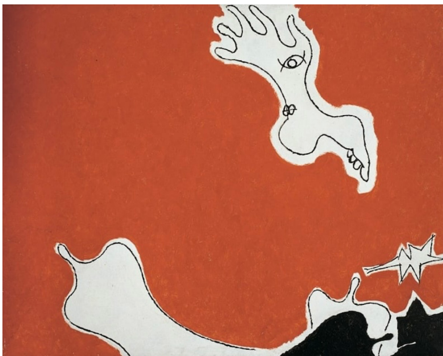
Fig. 5 – Osvaldo Licini, La grande amica , 1948.

«È necessario che l’insegnamento avvenga sempre a diretto contatto con le opere» (Caramel, 1966, p. 759), per questo motivo, la sezione italiana si apre con due “opere-segnale” di Lucio Fontana (1899-1968) – Concetto Spaziale, Attesa (1956 circa) – e Osvaldo Licini (1894-1958) – La grande amica (1948) (fig. 5) – scelti per «aprire i discenti alla comprensione delle peculiari caratteristiche del linguaggio figurativo, dissolvendo in loro ogni pregiudizio» e abituarli a «vedere e quindi a valutare le opere d’arte» (Caramel, 1966, p. 759).