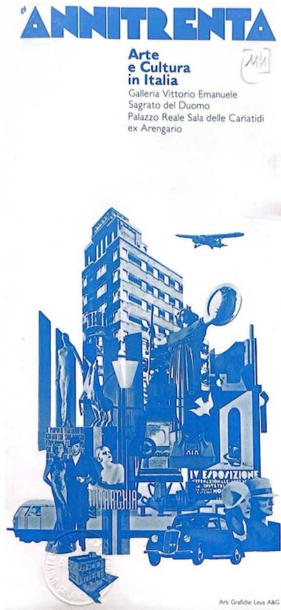
Fig. 2 – Brochure: Milano 1980 un programma per le arti visive, Fondo Luciano Caramel, Università Cattolica del Sacro Cuore, Milano.