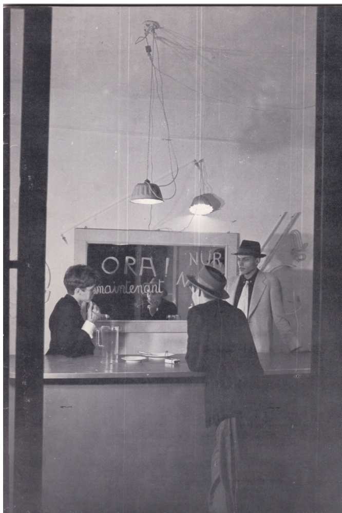
Fig. 2 – Copertina di Ora! , prima mostra degli Enfatisti, Pescara 1981.

Alinovi percepiva e leggeva, oltre che come base storica di Dada, anche quale esaltante anticipazione dalla contemporanea cultura punk e in particolare di certi suoi interpreti, primi fra tutti i Sex Pistols, più volte citati e utilizzati nei suoi scritti. Un parallelismo, quello fra Cravan e il punk, che verrà messo esplicitamente in luce solo molto più tardi, verso la fine degli anni Novanta 3 .